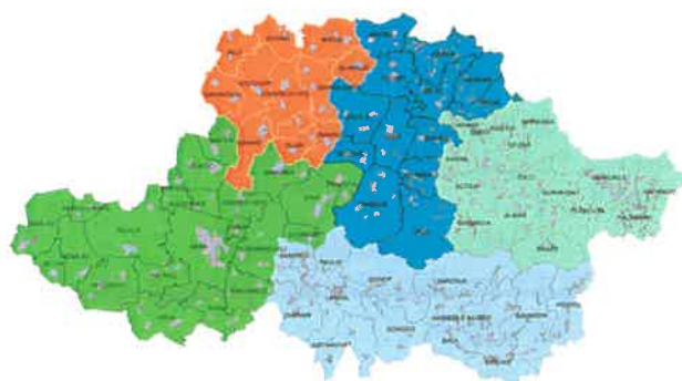
Figura 2 Zonele de colectare din județul Arad

Pentru o operare eficientă a sistemului integrat de management al deșeurilor, județul Arad a fost împărțit în 5 zone de colectare și transport, aferente stațiilor de transfer, respectiv Depozitului ecologic, astfel: